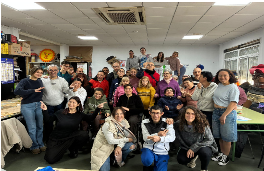
Wir, mit der Gruppe und den Betreuern