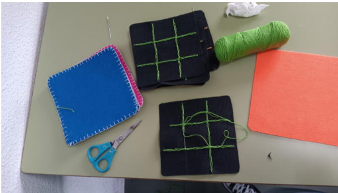
Tic-Tac-Toe, genäht um verkauft zu werden

Das Praktikum bot uns die Gelegenheit, Erfahrungen (sprachlich, sozial usw.) zu sammeln und Eindrücke in einer Einrichtung eines anderen Kulturkreises zu gewinnen.