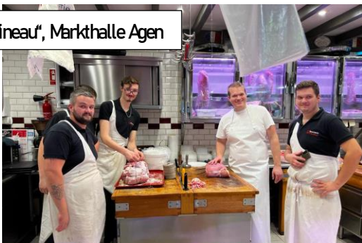
„Boucherie Pineau“, Markthalle Agen