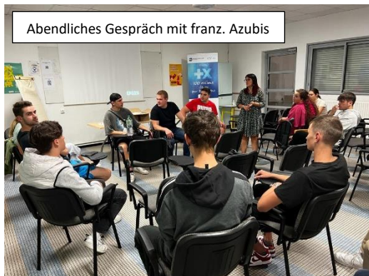
Abendliches Gespräch mit franz. Azubis